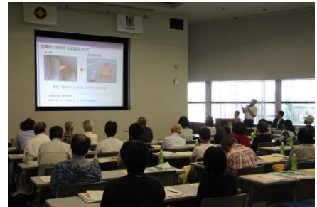
<前回講習会(H29.5.27)実施状況>

名古屋高速道路の運転が苦手な方や、 安全な運転を学びたい方を対象 募集定員：40名（応募者多数の場合は抽選）