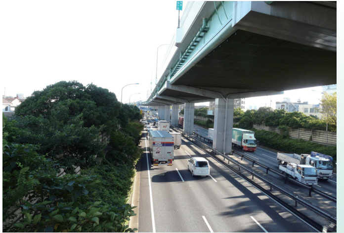
最近の高速 3 号大高線と一般国道 23 号 (南区要町付近・国道両側は環境施設帯)