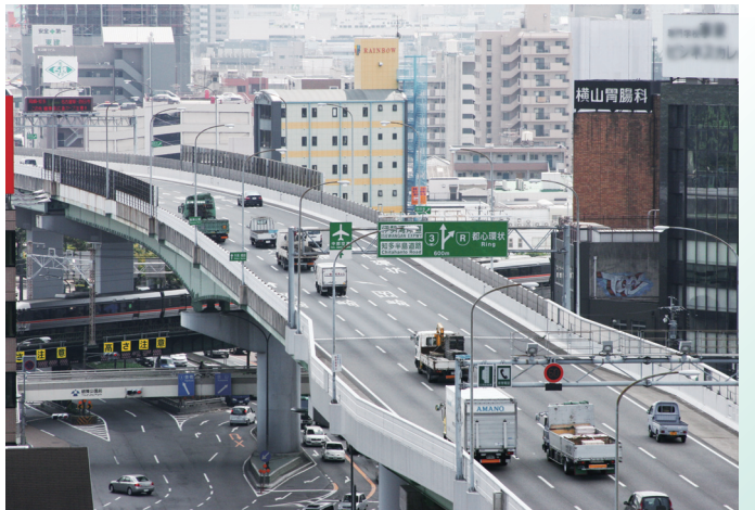
最近の高速都心環状線と JR 中央線との立体交差 (鶴舞公園前交差点付近)