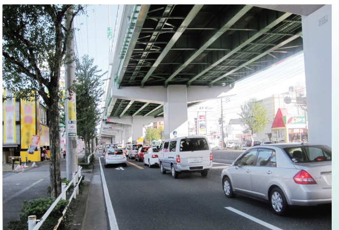
最近の高速 5 号万場線と県道津島七宝名古屋線 (万場大橋東側)