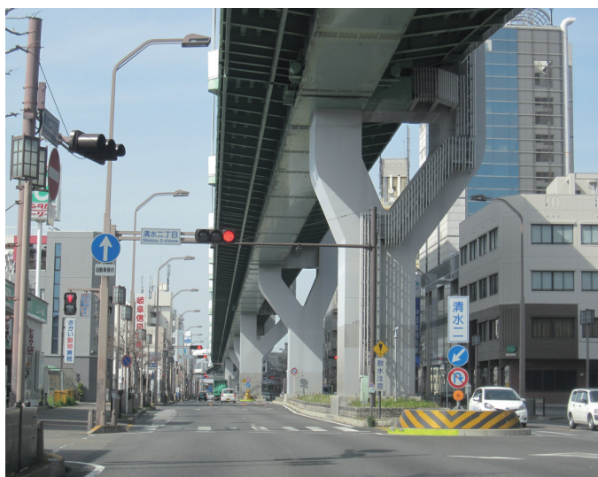
最近の高速 1 号楠線と一般国道 41 号 (北区清水 2 丁目)