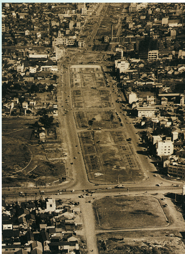
昭和 36 年当時の市道若宮大通 (白川公園付近) ※4