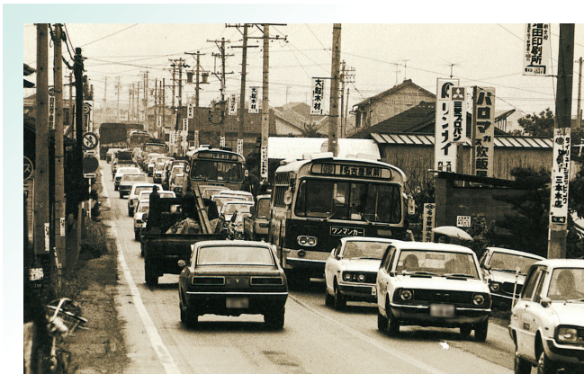
昭和 50 年代の県道津島七宝名古屋線 (万場付近・当時の道路名は県道中一色名古屋線) ※3