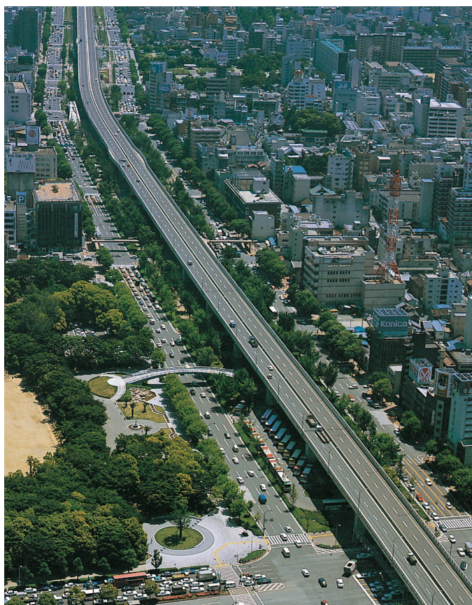
昭和 61 年開通直後の高速 2 号東山線と市道若宮大通 (白川公園付近)