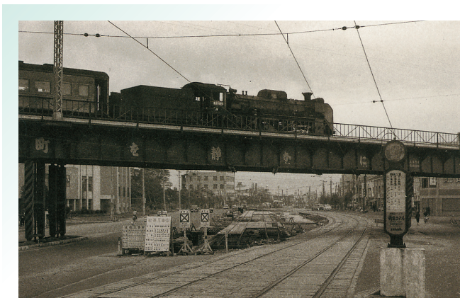
昭和 37 年当時の JR 中央線と市道堀田高岳線との立体交差 (鶴舞公園西側付近) ※2