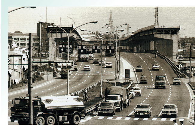
昭和 51 年当時の一般国道 23 号と建設中の高速 3 号大高線 (南区要町付近) ※1