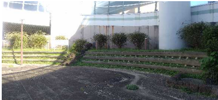
〈現在のレインボー黒川庭園〉