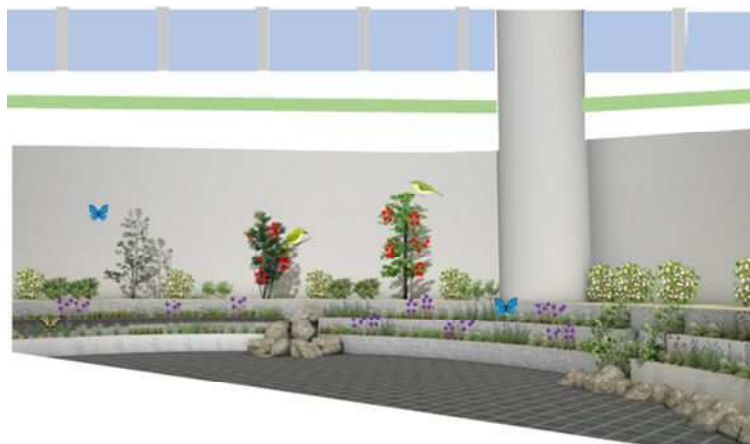
〈リニューアル緑化後イメージ〉