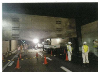
制水ゲートの点検

洪水対策として設置されている制水ゲートや通信設備の点検、橋の耐震補強工事のために設置した足場の撤去をおこないます。