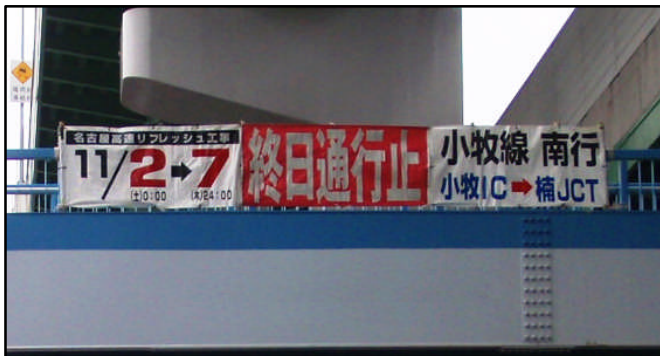
昨年度の横断幕掲示の状況