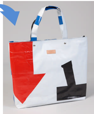
エコバッグイメージ