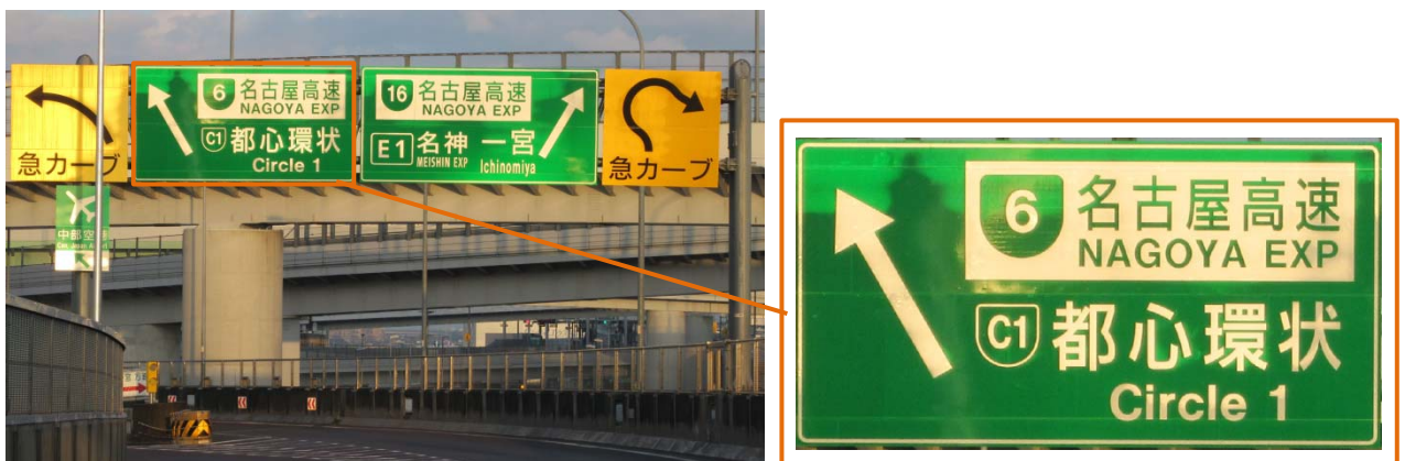
清洲 JCT の連絡路手前の設置状況

* 高速道路ナンバリングとは、整備が進む我が国の高速道路ネットワークにおいて、路線名にあわせて路線番号を用いて、訪日外国人をはじめ、すべての利用者にわかりやすい道案内を実現するものです。