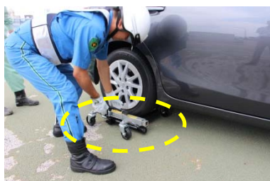
車両移動用ジャッキ※