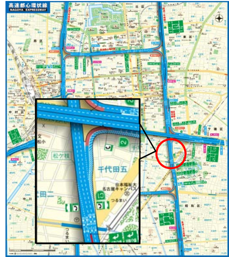
整流化対策実施箇所図 (丸田町 JCT 合流部)