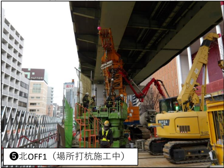
⑤ 北OFF1 (場所打杭施工中)