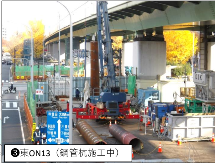
③ 東ON13 (鋼管杭施工中)