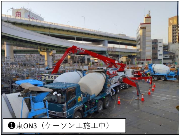
① 東ON3 (ケーソン工施工中)