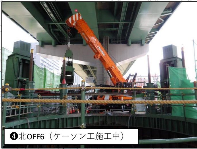
④ 北OFF6 (ケーソン工施工中)