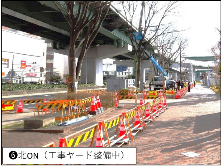
⑥ 北ON (工事ヤード整備中)