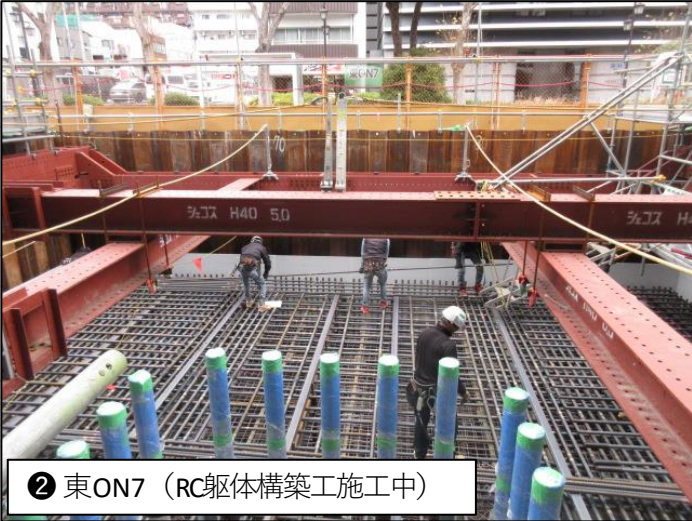
② 東ON7 (RC躯体構築工施工中)